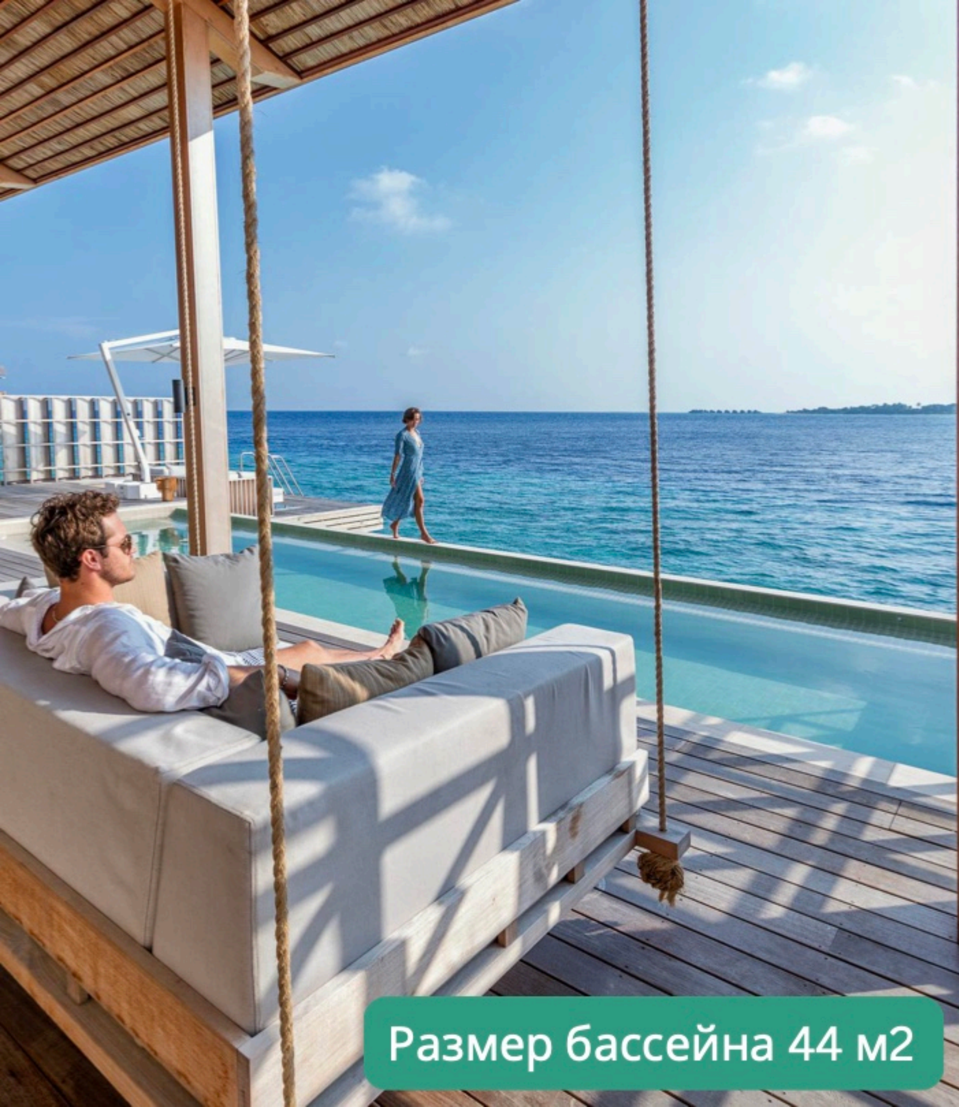
Размер бассейна 44 м2