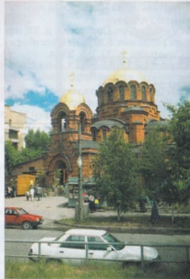
Собор Св. Александра Невского

ВЫЗОВ ТАКСИ . . . . . 008, 18-18-18, 107-107, 100-200